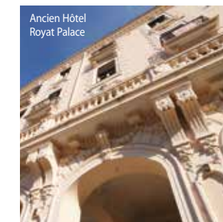
Ancien Hôtel Royal Palace

Départ : Office de Tourisme, Royat-Chamalières à 17 h