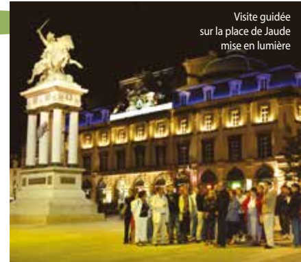
Visite guidée sur la place de Jaude mise en lumière

Jedi : 20 h 30 Départ : devant la Maison du Tourisme, place de la Victoire