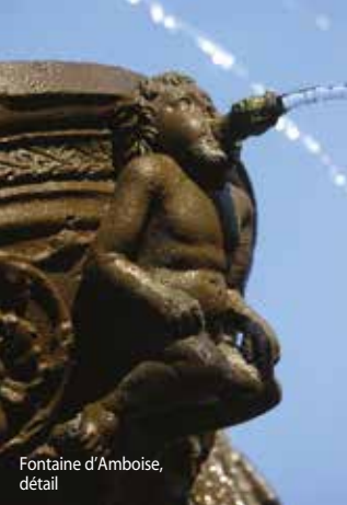
Fontaine d'Amboise, détail