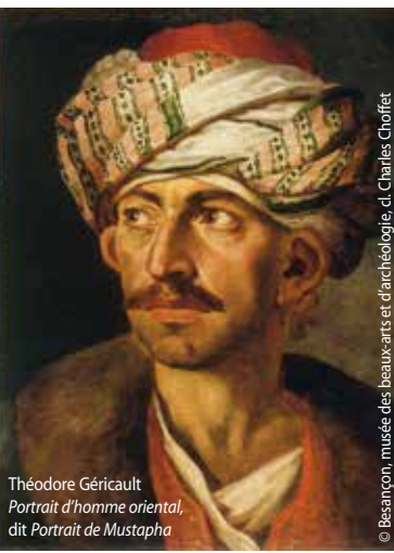
Théodore Géricault Portrait d'homme oriental, dit Portrait de Mustapha

Jedi : 15 h Départ : muni de son billet à l'accueil du MARQ, quartier historique de Montferrand.