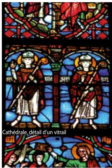
Cathédrale, détail d'un vitrail