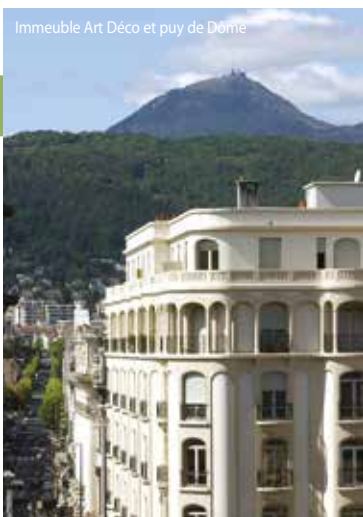
Immeuble Art Déco et puy de Dome

Samedi : 15 h Départ : Maison du Tourisme, place de la Victoire