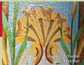
Mosaïque du Pavillon Saint-Mart

• Exposition De David à Courbet : Entrée + visite guidée (1 h 30) Tarif : 9 € (6 € pour les détenteurs gratuits du musée, sur justificatif)