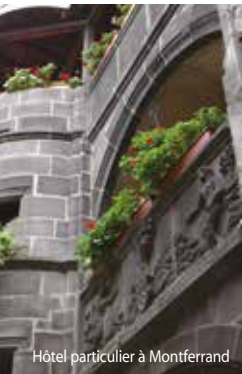
Hôtel particulier à Montferrand

Tous les mercredis, du 12 juillet au 16 août inclus, dégustation de fromages offerte par l'Association des Fromages AOP d'Auvergne.