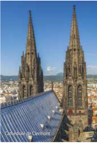
Cathédrale de Clermont

L'Office de Tourisme communautaire propose des visites guidées des centres anciens pour les individuels, sous la conduite de guides conférenciers agréés.