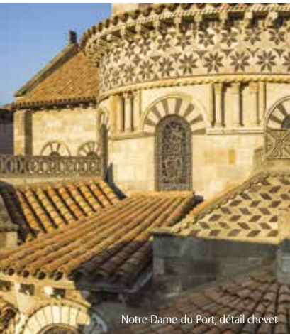
Notre-Dame-du-Port, détail chevet

Lundi et mercredi : 11 h Départ : Maison du Tourisme, place de la Victoire.